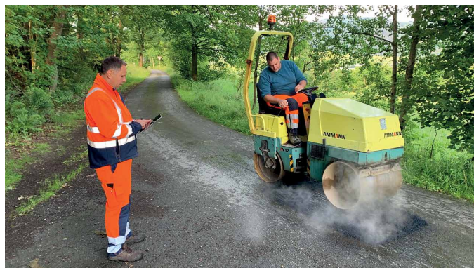
Was früher in zeitintensiven Berichten und Tabellen handschriftlich festgehalten werden musste, wird nun digital und zügig per Smartphone oder Tablet in eine vorbereitete Maske der App eingegeben.